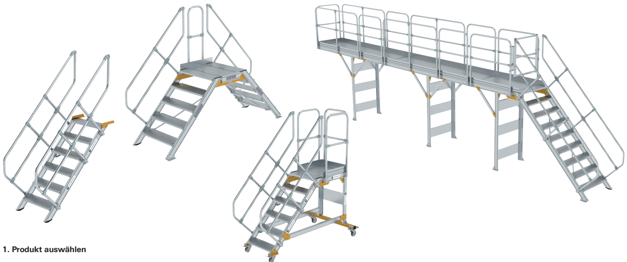
1. Produkt auswählen

Info: den Konfigurator der Günzburger Steigtechnik entdecken und von vielen Vorteilen profitieren. Ein anschauliches Video erklärt den einfachen und intuitiven Umgang mit dem praktischen Online-Tool - bei Rückfragen hilft Ihnen das Serviceteam der Günzburger Steigtechnik gerne persönlich weiter.