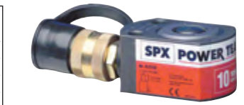
Typ RLS 100