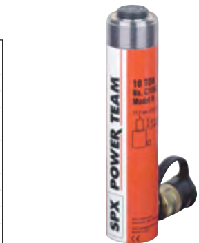
Typ C 106 C