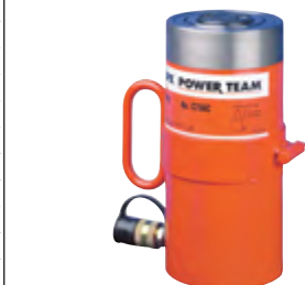
Typ C 10010 C

Alle Angaben verstehen sich als unverbindliche Richtwerte! Für nicht schriftlich bestätigte Datenauswahl übernehmen wir keine Haftung. Druckangaben beziehen sich, soweit nicht anders angegeben, auf Flüssigkeiten der Gruppe II bei +20°C.