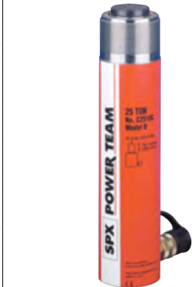
Typ C 2510 C